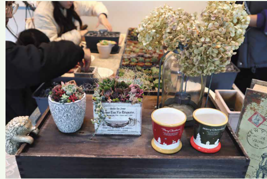
ワークショップとハンドメイド作品の販売