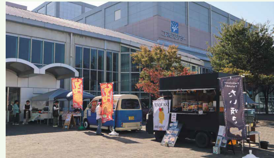
前庭にはキッチンカーがやってきます