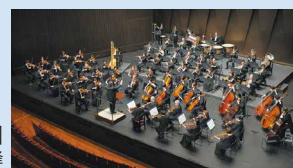
大阪交響楽団