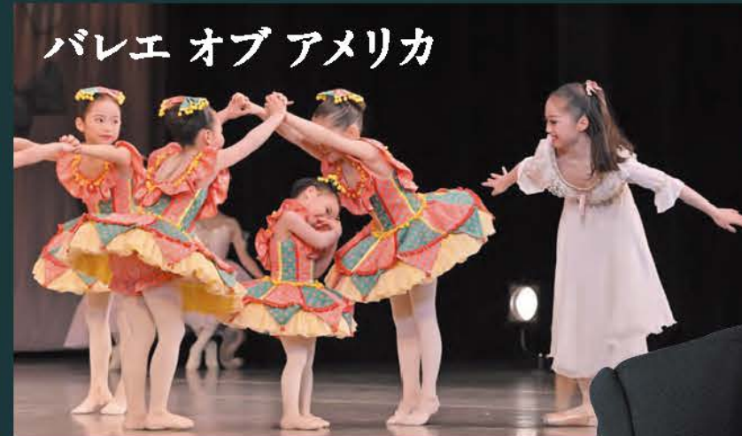
バレエ オブ アメリカ