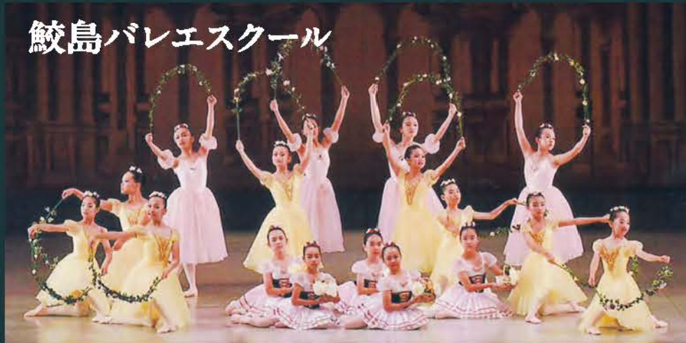
鮫島バレエスクール